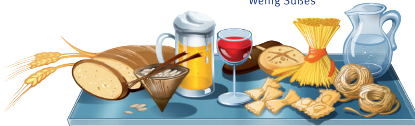
Getreide, Getreideprodukte, Reis, Nudeln, ein Glas Wein oder Bier