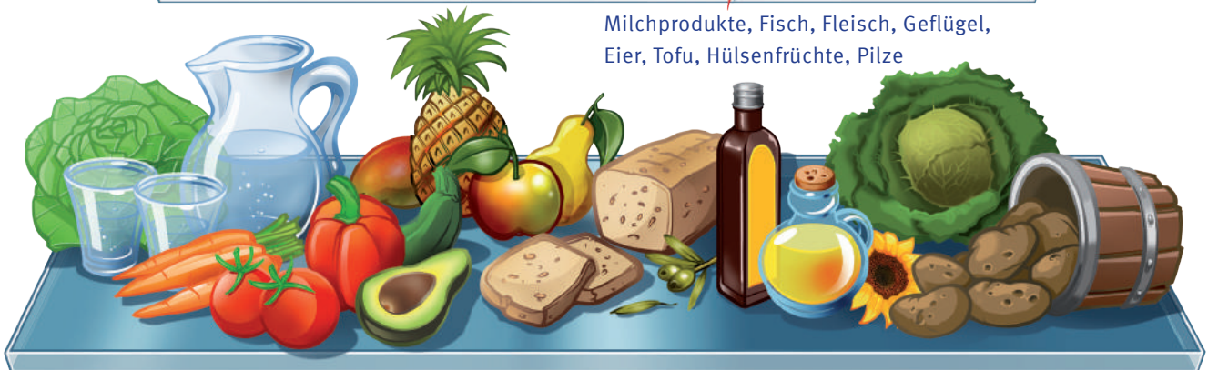
Frisches Obst, Gemüse, Salat zubereitet mit gesundem Öl, Roggenbrot, Pellkartoffeln