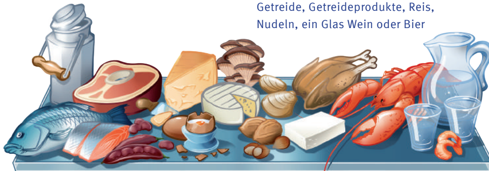
Milchprodukte, Fisch, Fleisch, Geflügel, Eier, Tofu, Hülsenfrüchte, Pilze